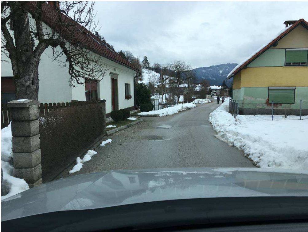
Slika 4: Pogled na traso