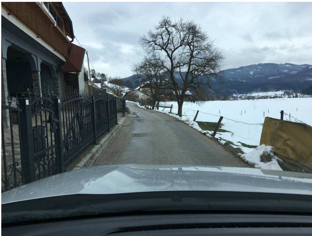
Slika 6: Pogled na traso