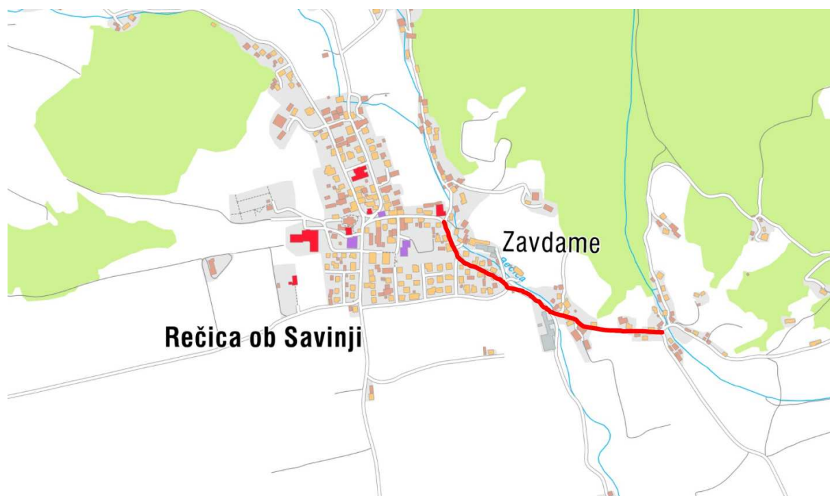
Slika 1: Lokacija odseka

Na osnovi naročila občine Rečica ob Savinji smo izdelali tehnično dokumentacijo za javni razpis rekonstrukcije javne poti JP 768-061 v skupni dolžini 617,00 m.