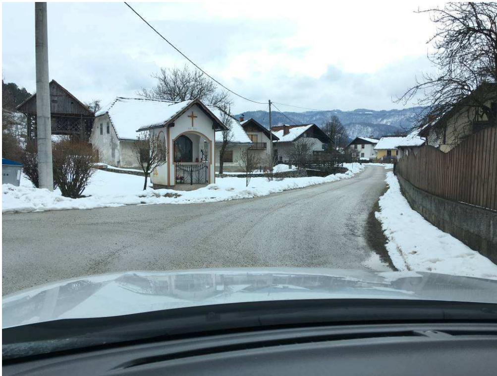
Slika 2: Začetek trase