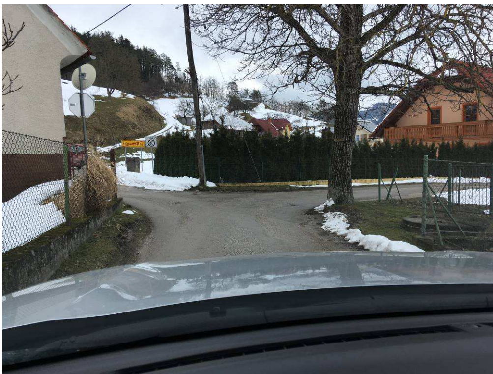
Slika 7: Konec trase