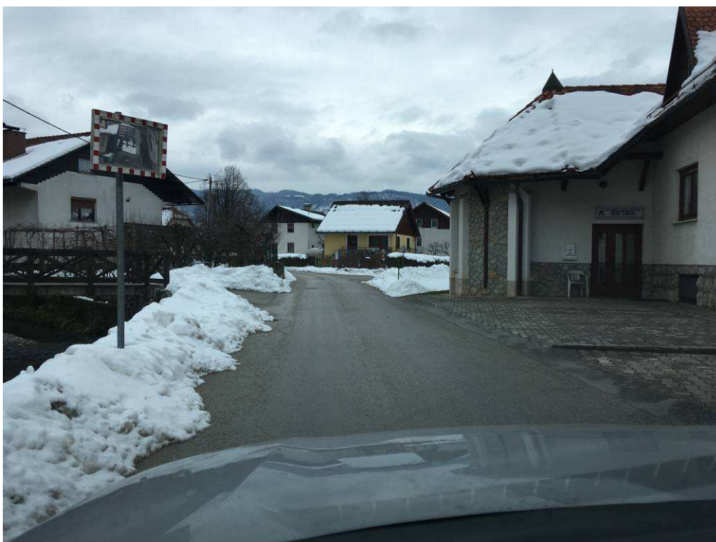
Slika 3: Pogled na traso