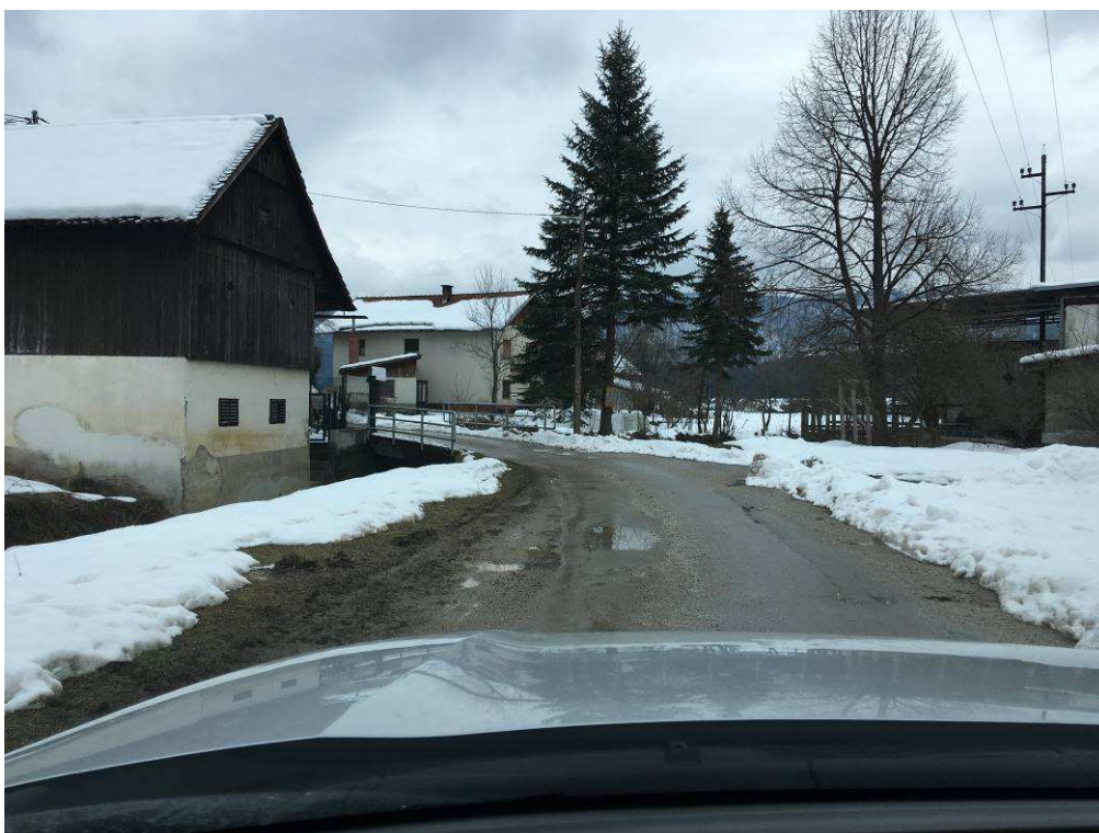
Slika 5: Pogled na traso